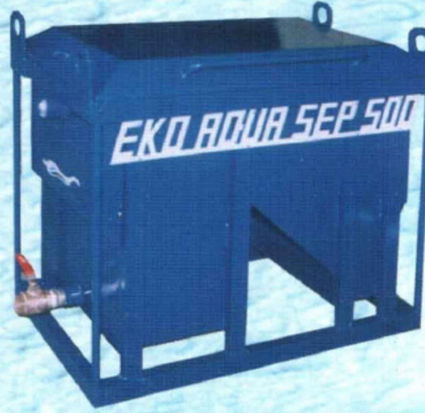
EKO AQUA SEP Yağ ve AKM (askıda katı madde) Separatörü