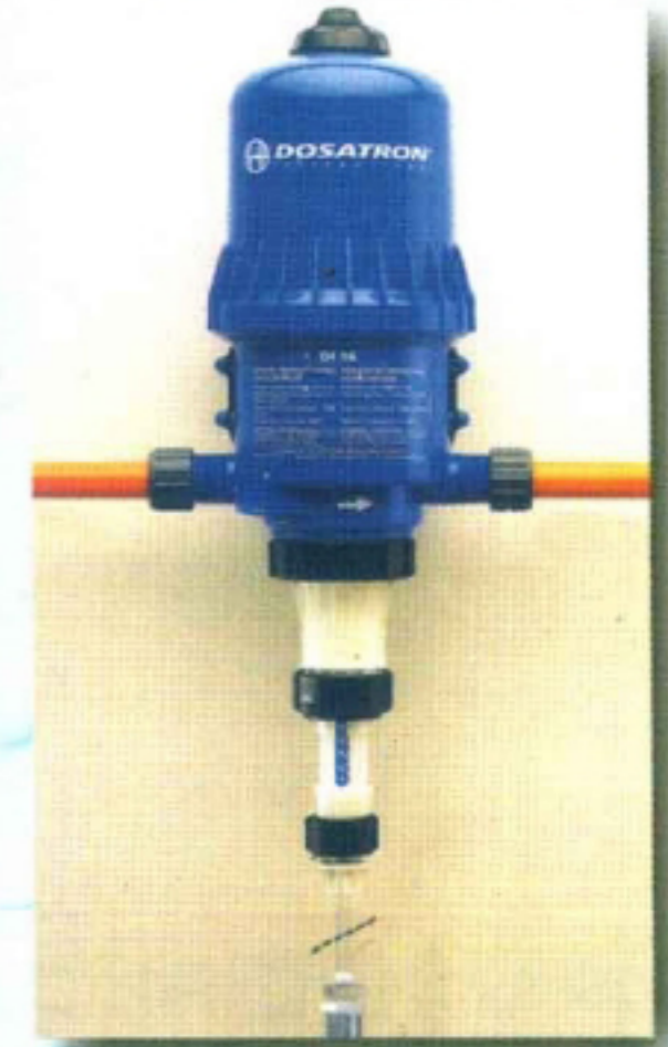
DOSATRON Elektriksiz Oransal Dozaj Pompası