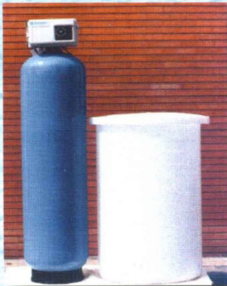
Su Yumuşatma Ünitesi